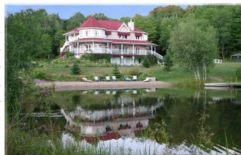
L'auberge Le Louis Philippe II

Le 9 mars dernier, Tourisme Lanaudière a dévoilé les 29 candidats finalistes de la 25e édition du gala des Grands Prix du tourisme Desjardins de Lanaudière. Cette année nous avons la chance d'avoir parmi ces finalistes, l'Auberge Le Louis Philippe II, Gîte –Bed & Breakfast-Inn qui se situe à Notre-Dame-de-Lourdes.